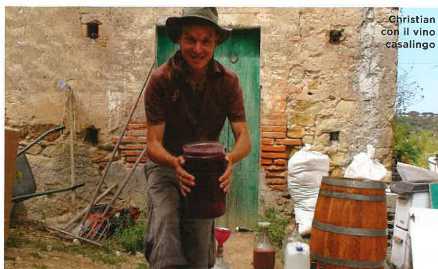
Christian con il vino casalingo

di bagni con impianto di compostaggio e docce solari termiche. Ci sarà anche una torre annessa a una grande casa sull'albero con tre terrazze. E altre casette, le tiny house , realizzate con materiali naturali. Tutti sono benvenuti sulla nostra verde collina dell'avventura. Unico requisito: rispettare persone e ambiente. Servono anche sete di avventura e spirito pionieristi-