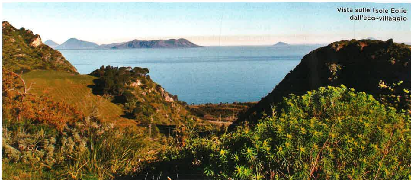
Vista sulle isole Eolie dall'eco-villaggio