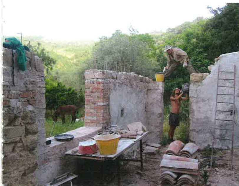
Alcuni lavori di costruzione dell'eco-villaggio

persone che venivano sia per aiutare che per passare le vacanze. Sempre in un contesto molto spartano, al limite dell'accettabile. Nonostante questo, sono arrivati in migliaia, giovani e meno giovani. Confluiti da tutte le parti del mondo. Oltre che dall'Europa e dall'America, anche da molti