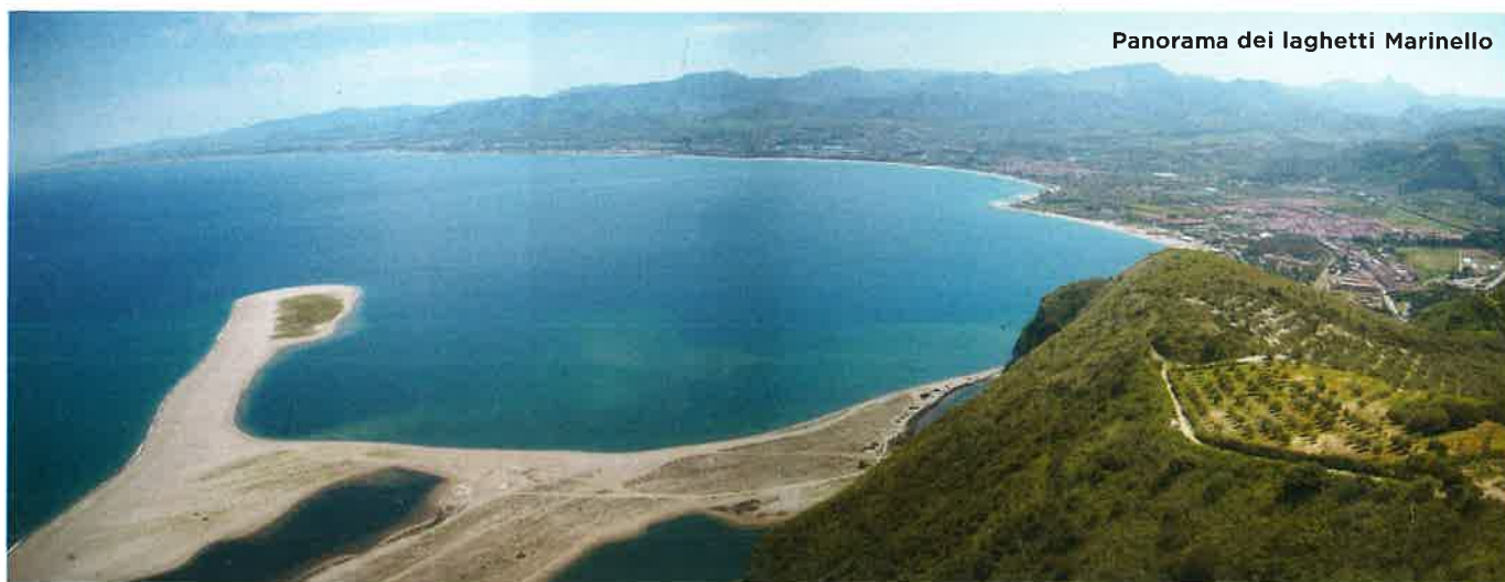
Panorama dei laghetti Marinello